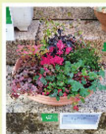
公園人気投票1位 ライトアップ 小林雅子さま