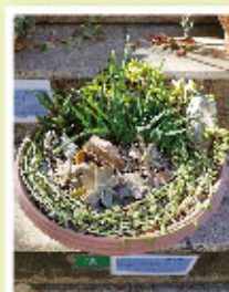
港区立みなと科学館賞 ロックだぜ!! 六九児郎さま