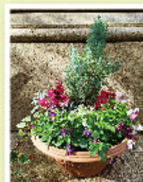
リスト・ハンガリー文化センター賞 Red Christmas みんな笑顔に 長崎順子さま