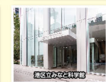
港区立みなと科学館

麻布地区公園・児童遊園の樹木の写真展を開催します。身近な公園でよく見る木の名前や特徴をおこさまから大人まで楽しめる内容で展示します。