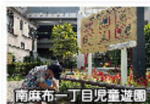
有栖川宮記念公園