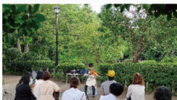
会場は広尾口のすぐ近くの池の前です