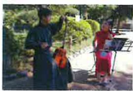
2022年秋のランチタイムコンサート

沖縄育ちで8歳から二胡を始め、高校で北京へ渡り北京現代音楽学院へ入学し二胡の修行を始める。中央民族大学、中国音楽学院共に初の二胡専攻日本人卒業生となる。2020年7月大学院を卒業、同年6月にMAYA二胡教室音昇星を開校。