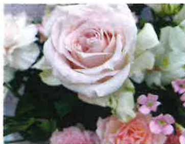
①5/12(日) 母の日プレゼント