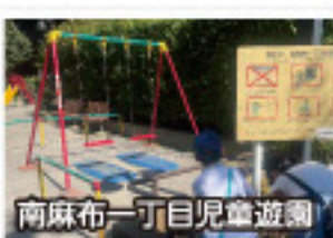
南麻布一丁目児童遊園