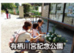
有栖川宮記念公園