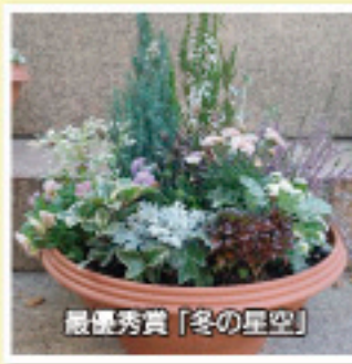
最優秀賞「冬の星空」