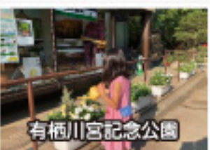
有栖川宮記念公園